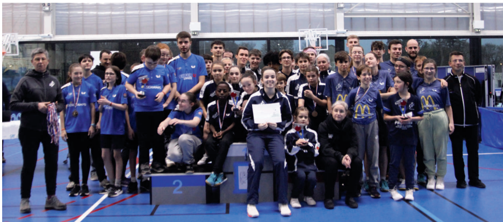
Podium du Challenge Bernard Jeu 2024

14 janvier 2024 à Loué (72) • Vainqueur : Le Mans Sarthe TT 1 • 2e : Ernéenne Sport TT • 3e : Le Mans Sarthe TT 2