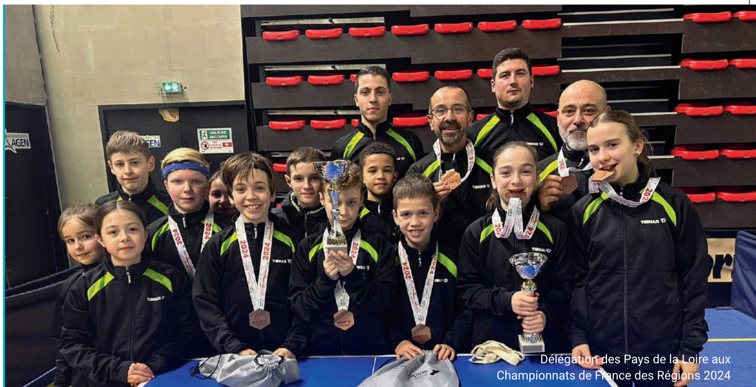
Délégation des Pays de la Loire aux Championnats de France des Régions 2024