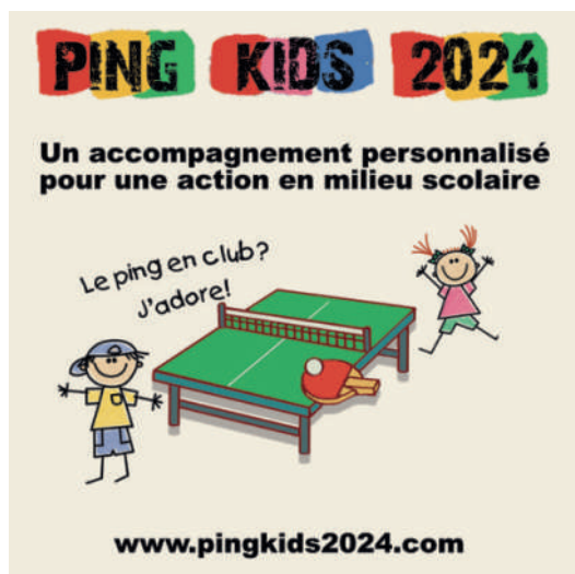
Action Ping Kids 2024 à Aizenay (85)

Le rendez-vous est pris pour la cinquième édition !