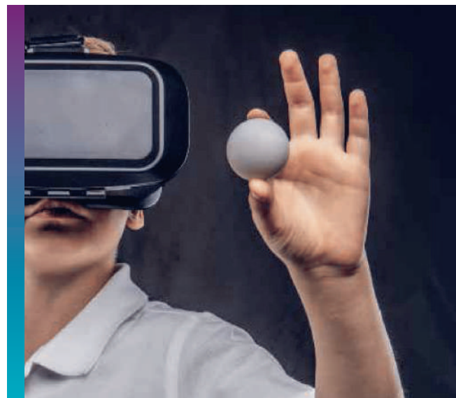
Le e-Ping ou Ping en Réalité Virtuelle est l'une des pratiques alternatives de demain.

Au mois d'octobre ou novembre, la Ligue aura une réponse pour la candidature déposée auprès de l'agence Erasmus+ Sport, pour un projet portant sur la place des femmes dans le tennis de table. S'il est retenu, ce projet mené en collaboration avec la Fédération Suédoise de Tennis de Table et la DWATTM (rattaché à la région Tyrol en Autriche) impulsera une véritable dynamique dans laquelle les clubs et personnes volontaires pour contribuer et partager seront les bienvenus.