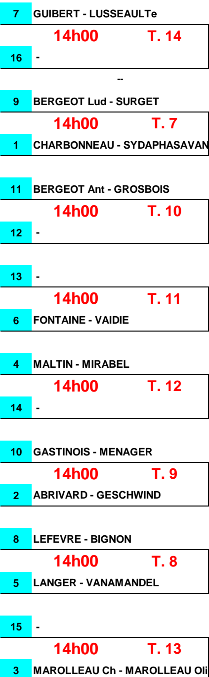
Tableau DOUBLES MESSIEURS